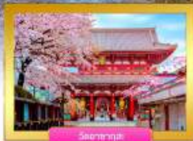
วัดฮาซากุสะ